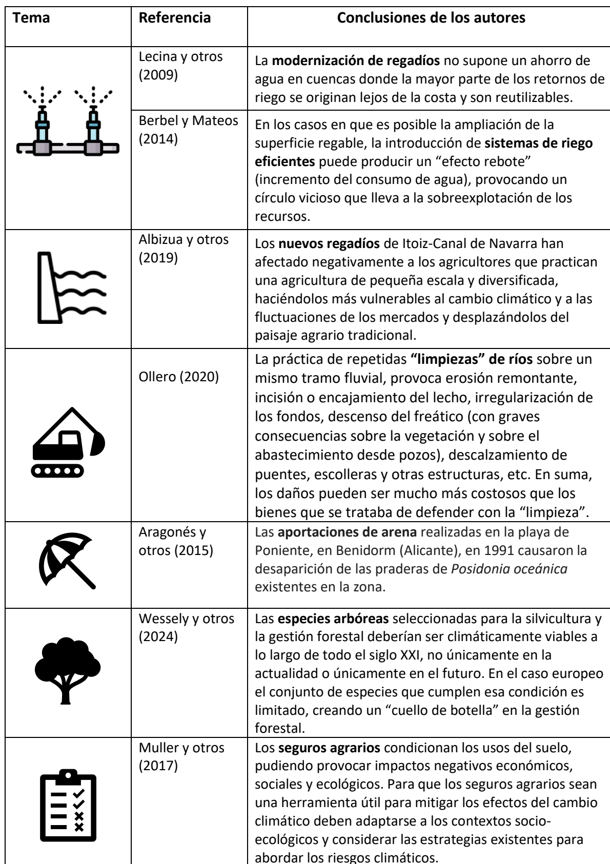
Tabla 1. Ejemplos de casos estudiados que incluyen el territorio español en los que se identifican efectos maladaptativos