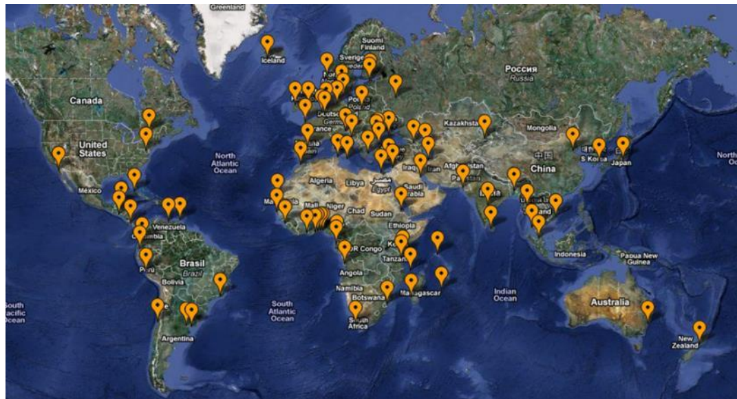
Red mundial de NODC

IODE (International Oceanographic Data and Information Exchange) es el programa de la Comisión Oceanográfica Internacional (IOC) de la UNESCO iniciado en 1961 para impulsar la investigación marina y el desarrollo mediante el intercambio de datos e información marina entre sus estados miembros.