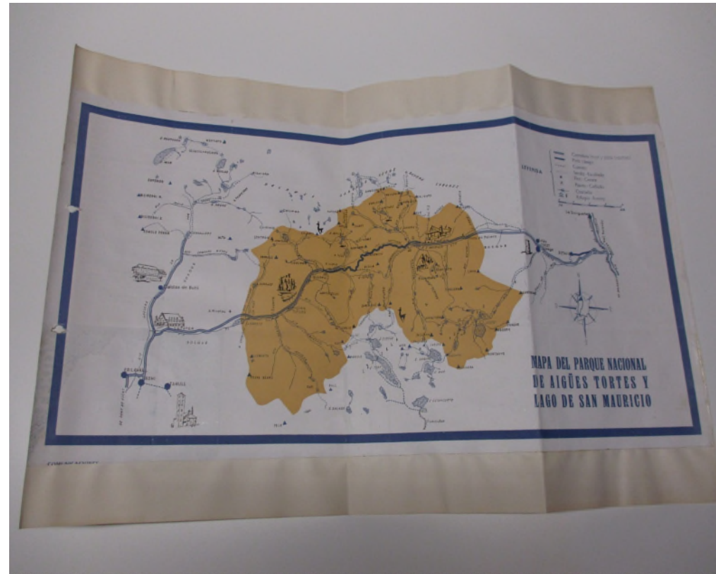
Mapa del Parque de los años 60