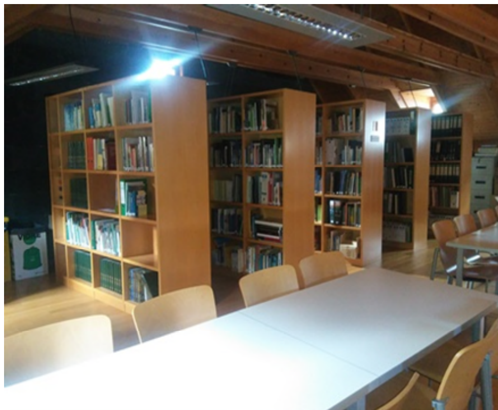
Centro de Documentación