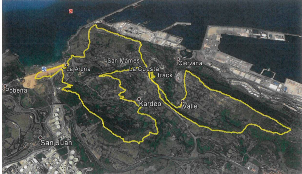
Figura 1: Recorrido completo carrera "Galipa Mendi Bira 2025".