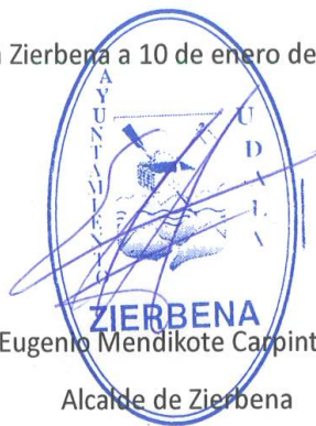
Eugenio Mendikote Carpintero Alcalde de Zierbena