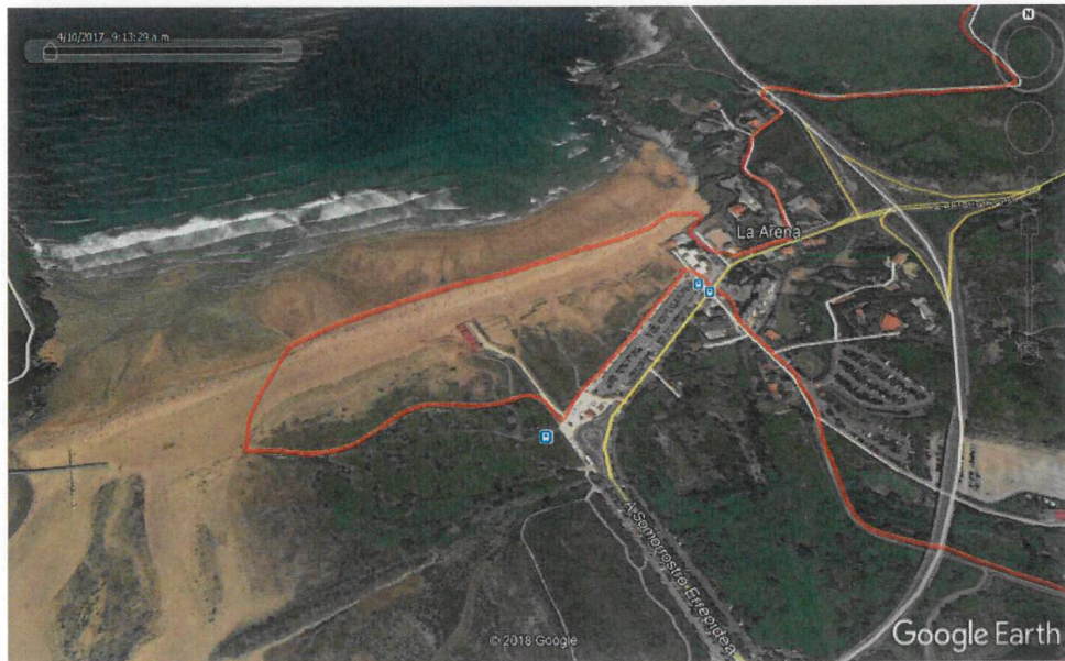
Figura 2: Recorrido por la playa de La Arena "Galipa Mendi Bira 2025".