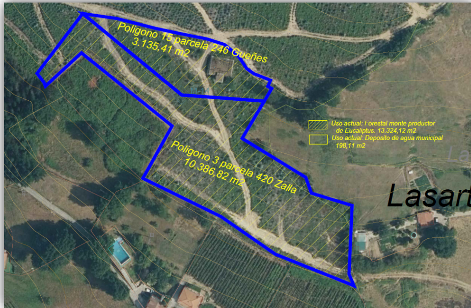
Ámbito del proyecto