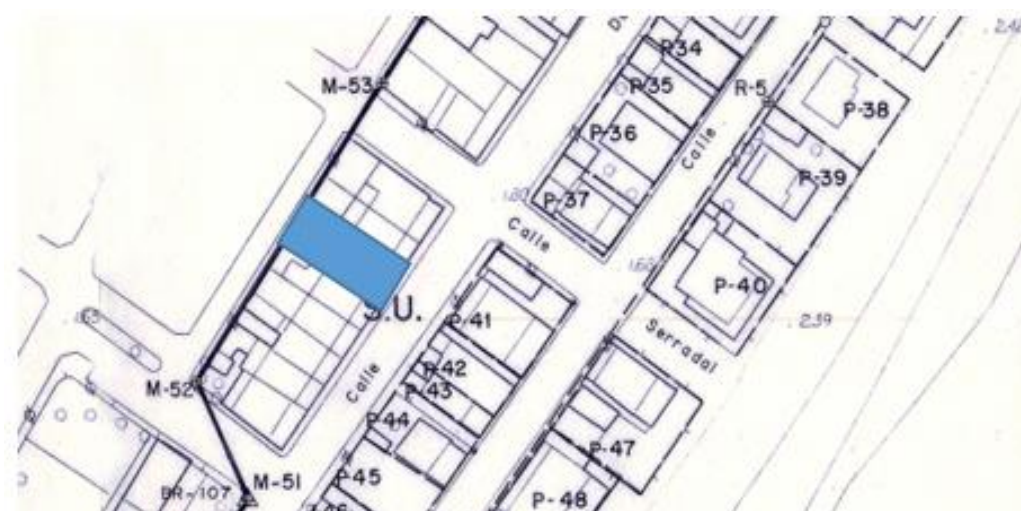
Imagen 2. Ortofoto con superposición de las líneas del deslinde y plano aprobado por orden ministerial 30 de junio de 1994.

2. Mediante Orden Ministerial de 30 de junio de 1994, se aprueba el deslinde en el término municipal de Almenara, con una longitud de 3.305 metros (DL-21-CS). De acuerdo con el plano de deslinde, los terrenos se localizan en ribera de mar, entre los actuales hitos M-52 y M-53.