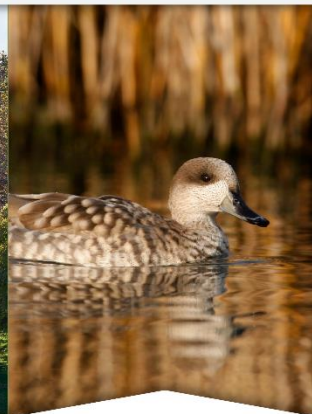
Causas de pérdida de biodiversidad