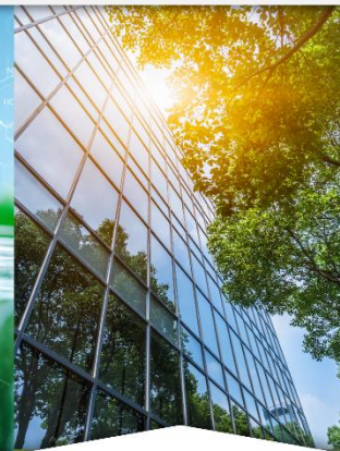
Participación del sector privado en la transición ecológica