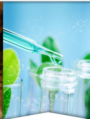
Generación y gestión del conocimiento