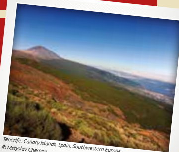
Tenerife, Canary Islands, Spain, Southwestern Europe

Por otra parte, a pesar de que la legislación nacional establecía que era necesario aportar una fianza suficiente para compensar el daño que se podría causar a la otra parte, antes de la concesión de la orden de reparación, el tribunal decidió que la exigencia de dicha fianza en este caso impediría efectivamente el acceso a la justicia de la ONG, previsto en la Convención. Si bien el tribunal conocía plenamente las consecuencias económicas de la interrupción del proyecto portuario, también comprendía que si la orden de reparación se hacía depender de una fianza, la ONG no podría seguir tramitando su solicitud, lo que significaba que la orden se dejaría inevitablemente sin efecto, lo que daría lugar a un daño irreversible al alga marina y al medio ambiente.