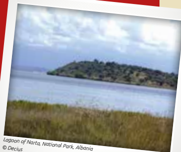
Lagoon of Narta, National Park, Albania

En su tercera sesión, celebrada en 2008, la Reunión de las Partes hizo suyas las conclusiones del Comité y emitió una decisión basada en las recomendaciones del mismo. Durante los tres años siguientes, el Comité procedió al seguimiento de los progresos realizados por Albania en el cumplimiento de las recomendaciones del Comité, y Albania informó sobre las medidas que estaba adoptando para cumplir sus obligaciones, de modo que el público pudiera participar en planes y actividades similares, incluidas las fases de seguimiento del proyecto de Vlora. En su informe presentado a la cuarta sesión de la Reunión de las Partes, celebrada en 2011, el Comité consideró que las medidas adoptadas por Albania eran suficientes y que ya no se encontraba en una situación de incumplimiento.