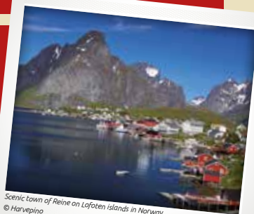
Scenic town of Reine on Lofoten Islands in Norway

Por lo tanto, el Consejo salió a la carretera, viajando de una ciudad a otra en un automóvil eléctrico e instalando carpas de información en los mercados y las plazas a fin de hablar cara a cara con la gente acerca del cambio climático y de la manera en que este cambio se relacionaba con su vida cotidiana. El Consejo ha trabajado arduamente para encontrar nuevas y divertidas maneras de relacionarse con la gente, y ha utilizado las redes sociales para fomentar en particular la participación de los jóvenes. Un notable éxito de esta gira fue el aumento del nivel de participación de quienes, como las personas de edad o los niños, quizá no habrían tenido otra oportunidad de participar.