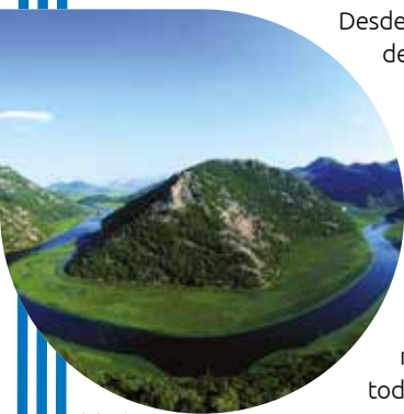
Skadar Lake - Montenegro

Desde la década de 1970, ha habido un reconocimiento cada vez mayor del vínculo existente entre las preocupaciones ambientales y los derechos humanos. En 1992, en la Conferencia de las Naciones Unidas sobre el Medio Ambiente y el Desarrollo o “Cumbre para la Tierra”, celebrada en Río de Janeiro, este vínculo se adoptó formalmente cuando 178 Gobiernos aprobaron la Declaración de Río sobre el Medio Ambiente y el Desarrollo, que todavía es considerada como una declaración histórica en la actualidad. En el Principio 10 de la Declaración de Río se estableció claramente, por primera vez en un instrumento internacional, que “el mejor modo de tratar las cuestiones ambientales es con la participación de todos los ciudadanos interesados” y que “toda persona deberá tener acceso adecuado a la información”, el derecho “a participar en los procesos de adopción de decisiones” y un “acceso efectivo a la justicia”.