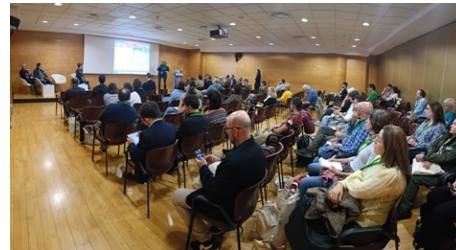
Stan de la CETS y momento durante la mesa de Ecoturismo, II CIMAS