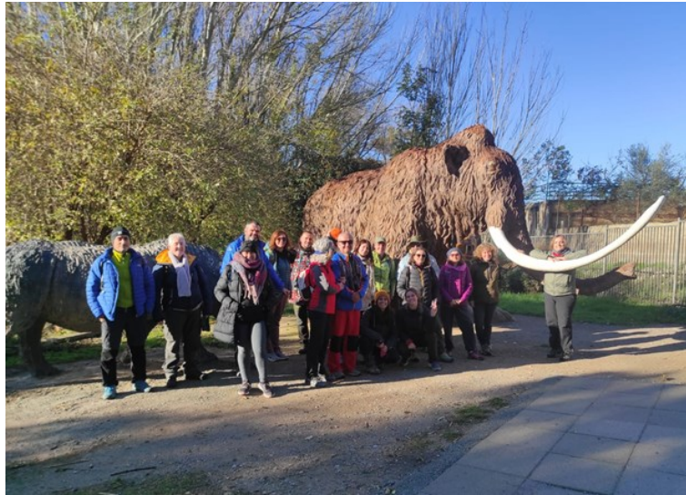
Participantes del curso "Accesibilidad y Ecoturismo Universal", organizado por ENTURNA.

Además, Del 10 al 13 de diciembre se celebró en el Aula de Naturaleza El Aguadero el curso "Accesibilidad y Ecoturismo universal" a través de la Escuela Internacional de Turismo Rural y Naturaleza, curso realizado a propuesta de la CETS en Sierra Nevada.