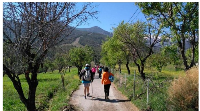
Ruta senderista por los parajes naturales de Fiñana

vención de la Consejería de Sostenibilidad, Medio Ambiente y Economía Azul de la Junta de Andalucía.