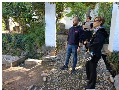
Visitas individualizadas a las empresas en proceso de adhesión a la CETS

Las empresas en proceso de adhesión son Multiaventura Alpujarra (Órgiva), Goyo Garrido Adventures (Cogollo de Guadix), Hotel Nueva Alcazaba (Busquístar), Hotel Andalucía (Lanjarón), Goinsitu (Granada) y Atrévete a Saber (Fondón).