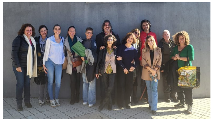
Representantes de entidades del Foro CES Sierra Nevada

“Coordinación entre entidades, asociaciones y otros colectivos locales”