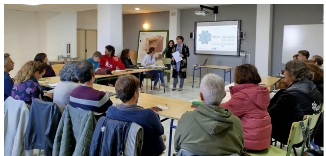
Participantes del Foro CETS Sierra Nevada

zando hacia un turismo más sostenible y responsable.