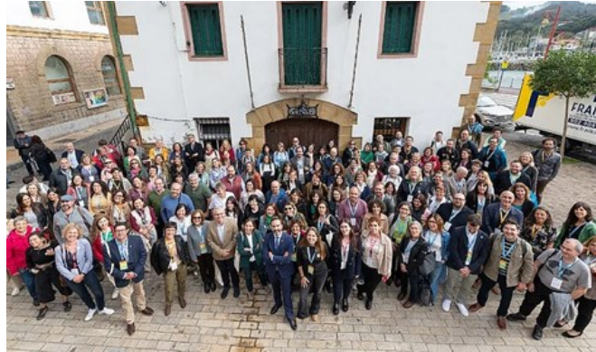
Participantes del VII Congreso Nacional de Ecoturismo