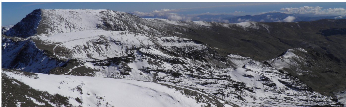
Cara sur y norte desde el Veleta 9-12-24