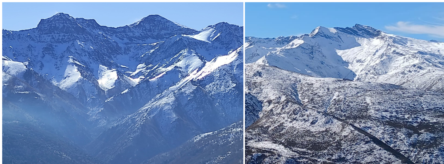
Vertiente norte 12-2-25