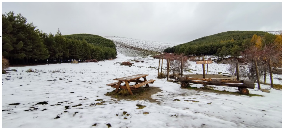
Puerto de La Ragua 13-11-24