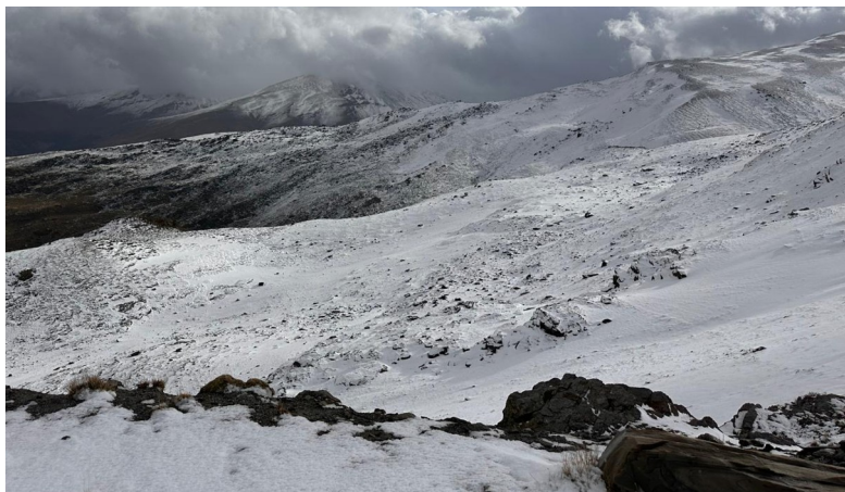
Vertiente norte 14-11-24