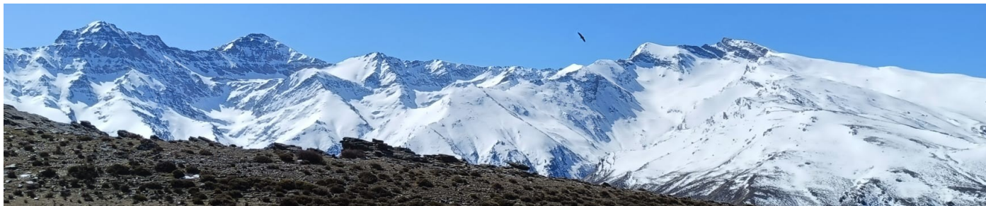
Vertientes norte y sur 1-4-25