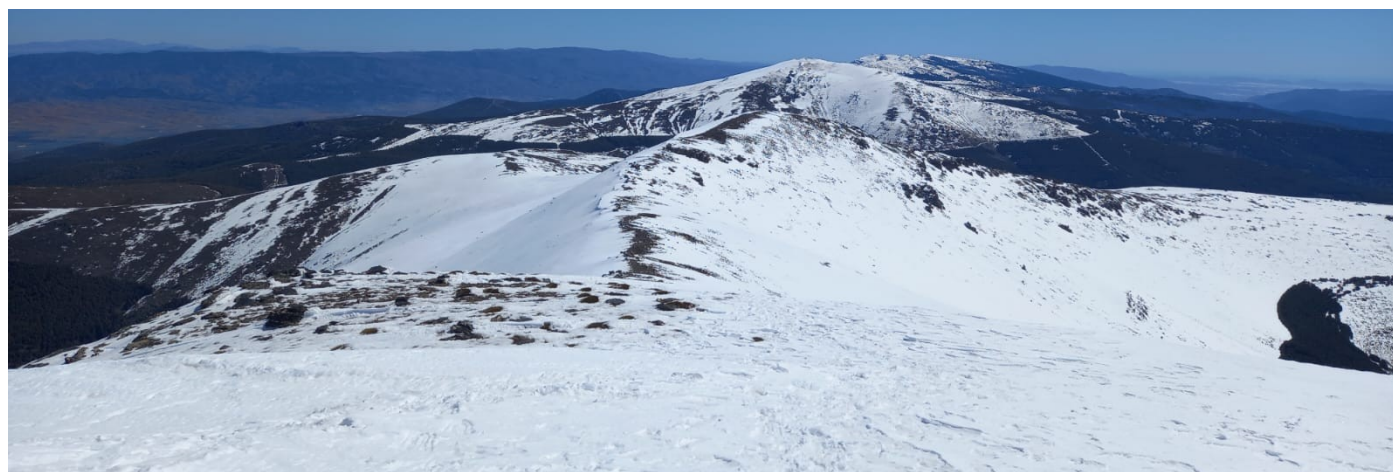
Desde el Morrón del Mediodía vistas hacia el este (del Sanjuanero a La Polarda) y hacia el oeste (del San Juan al Mulhacén) 31-3-25