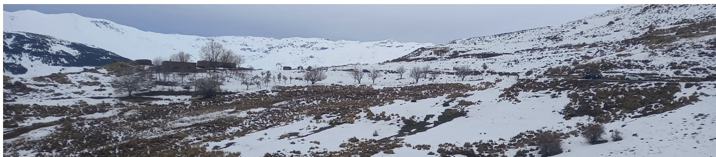
Cara sur 19-3-25