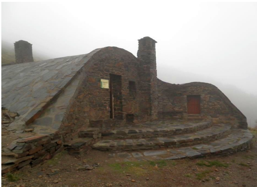
-Refugios EL MOLINILLO, EL DOCTOR y POQUEIRA cerrados por obras