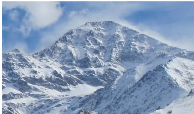
Alcazaba, Mulhacén y Veleta 18-3-25