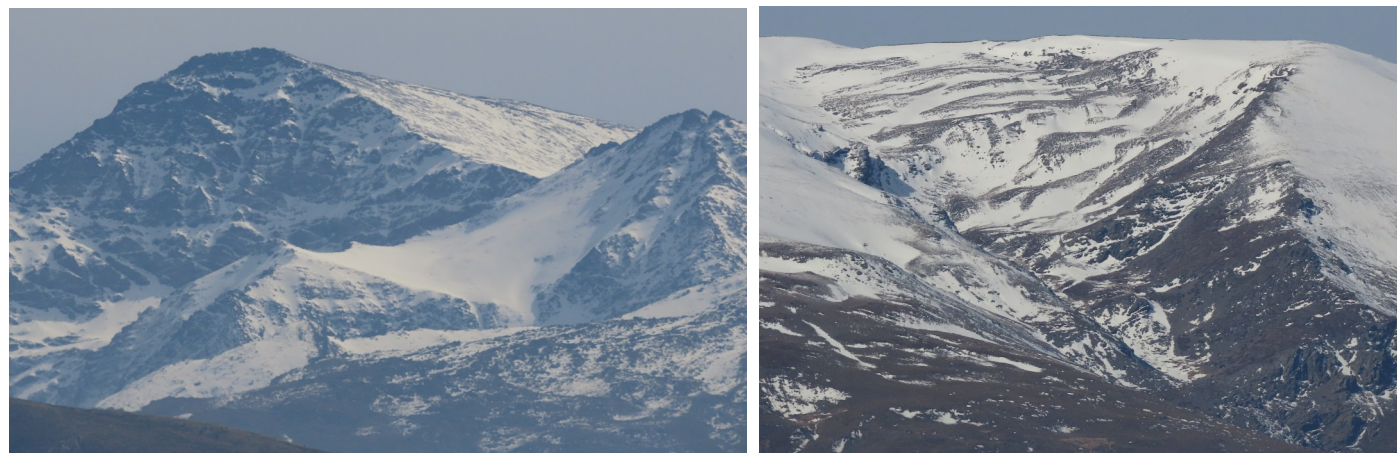
Cara norte Mulhacén y cabecera río Alhorí 25-2-25