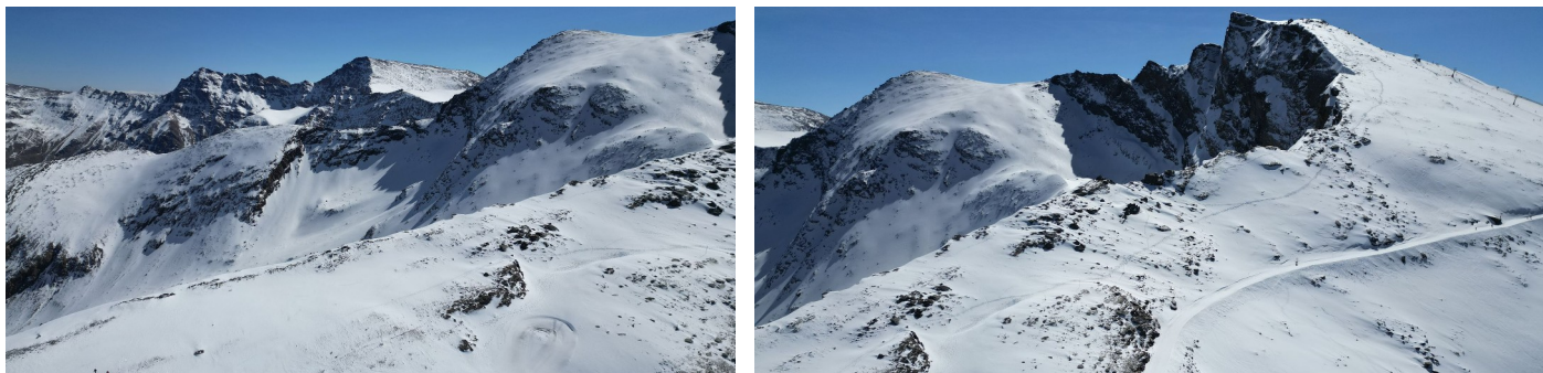
Vertiente norte 26-2-25