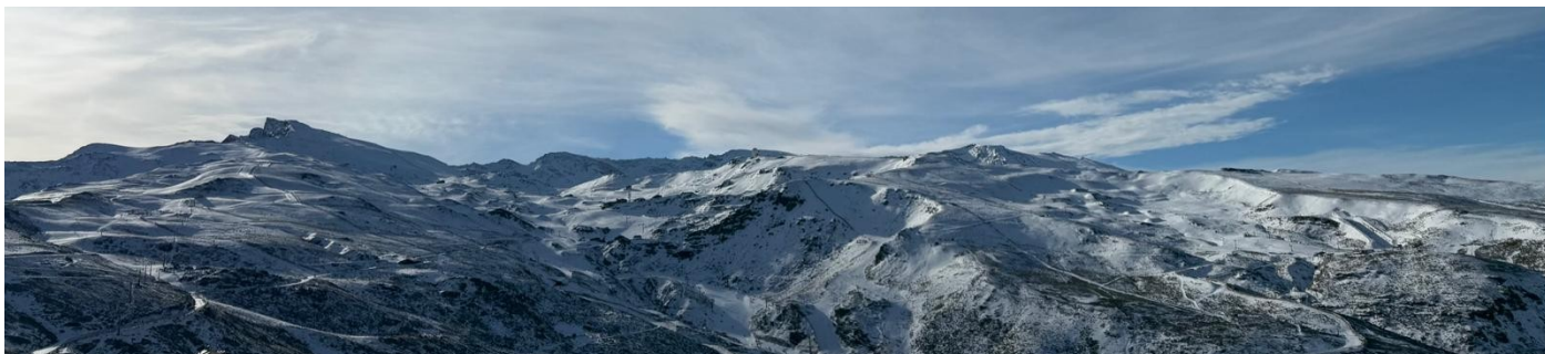
Del Veleta al tozal del Cartujo 29-1-25