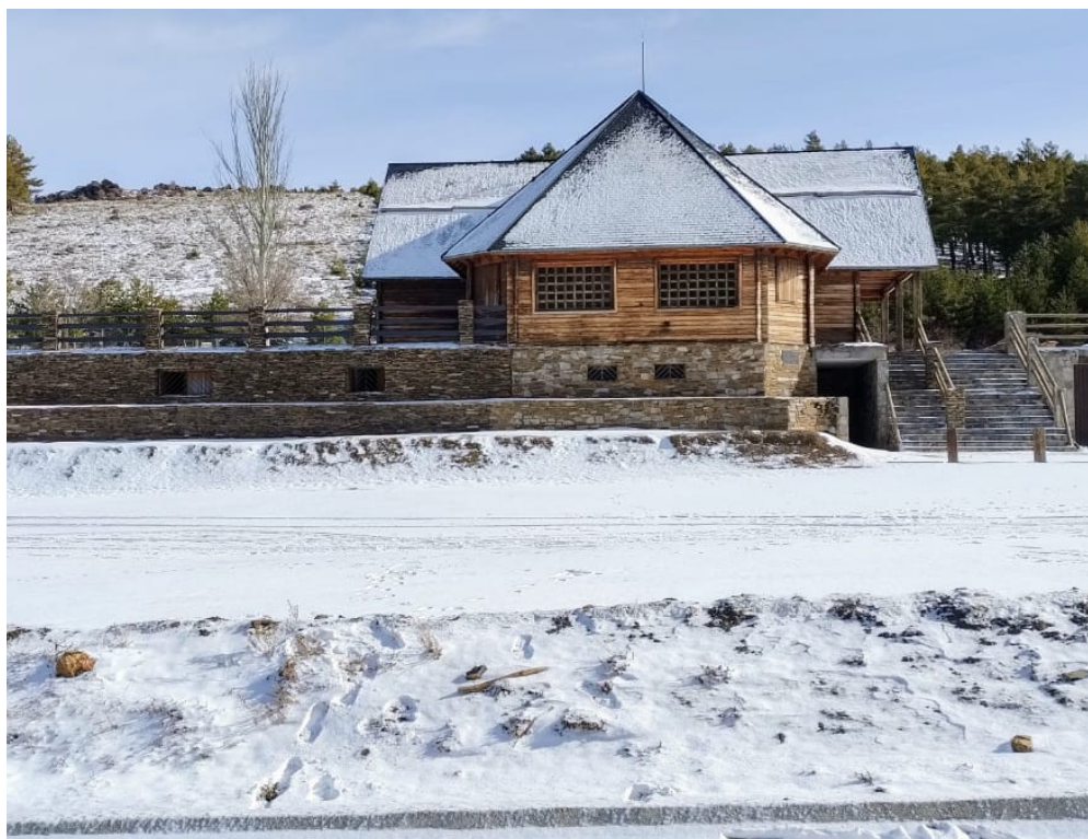
Precaución en el desplazamiento por carreteras, pistas y senderos