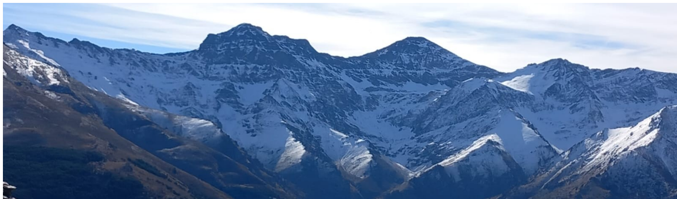
Alcazaba, Mulhacén y Veleta 7-1-25