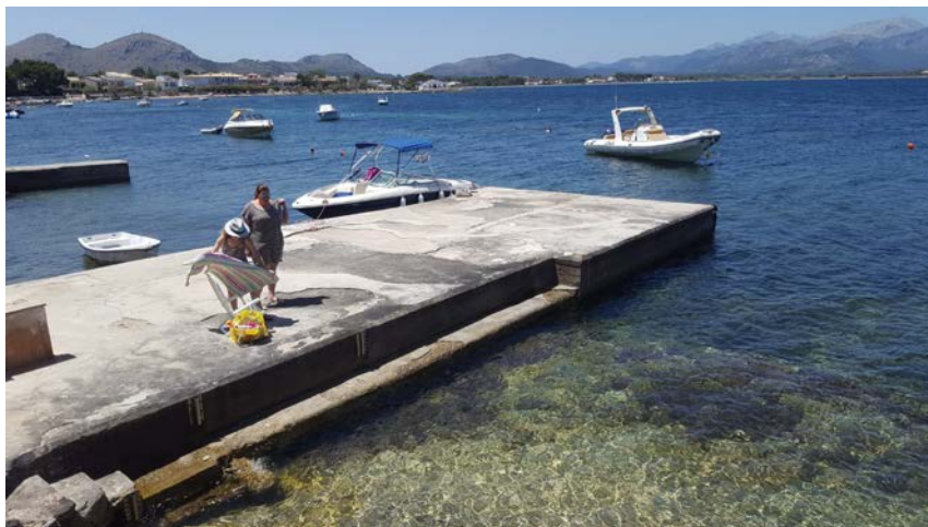
Foto: Embarcadero construido a principio de los años 60