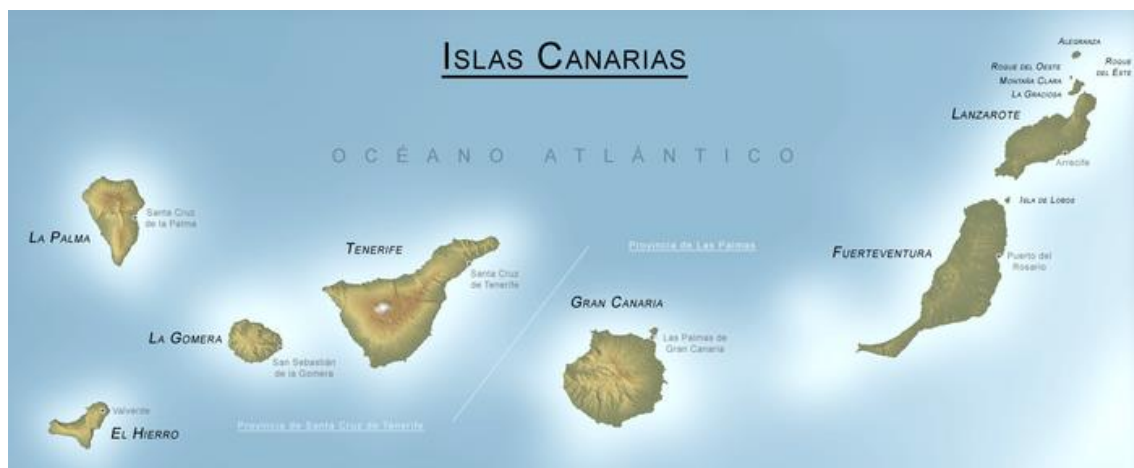
Figura 1.1. Mapa de las islas Canarias. Por Hansen.

Las islas Canarias se encuentran en el margen centrooriental del océano Atlántico. El archipiélago canario está situado frente a la costa noroeste de África, entre las coordenadas 27° 37' y 29° 25' de latitud norte y 13° 20' y 18° 10' de longitud oeste. La isla de Fuerteventura dista unos 95 km de la costa africana. Sin embargo, son aproximadamente 1.400 km los que separan a Canarias del continente europeo.